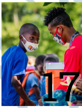
CCL y Covid-19