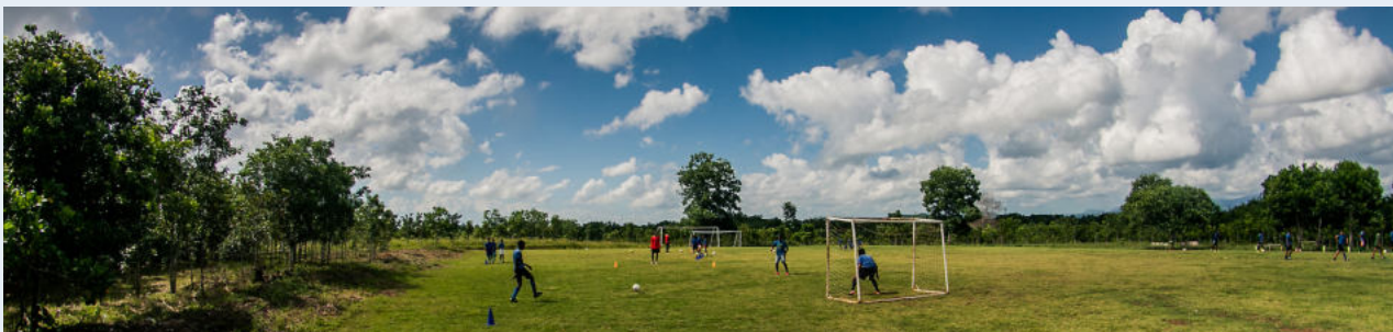
Las instalaciones de Café con Leche en 2020.

CCL se distingue de las demás organizaciones anfitrionas del programa "weltwärts" en la República Dominicana por el buen manejo de los voluntarios, por la multiculturalidad de su personal y por su compromiso social con los NNAJ y sus comunidades, así como por su gran seriedad en el manejo de sus recursos financieros y sus recursos humanos.