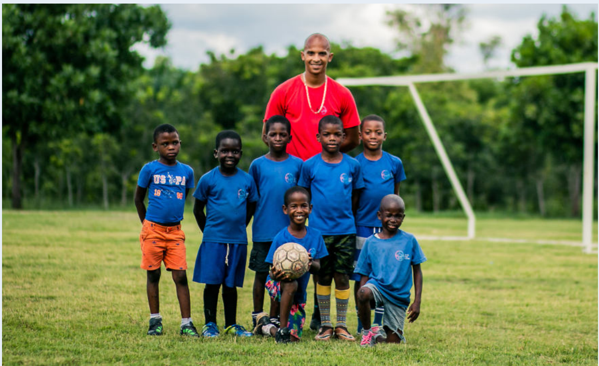
Práctica de CCL en octubre 2020.

Respuesta anónima del cuestionario de satisfacción 2020