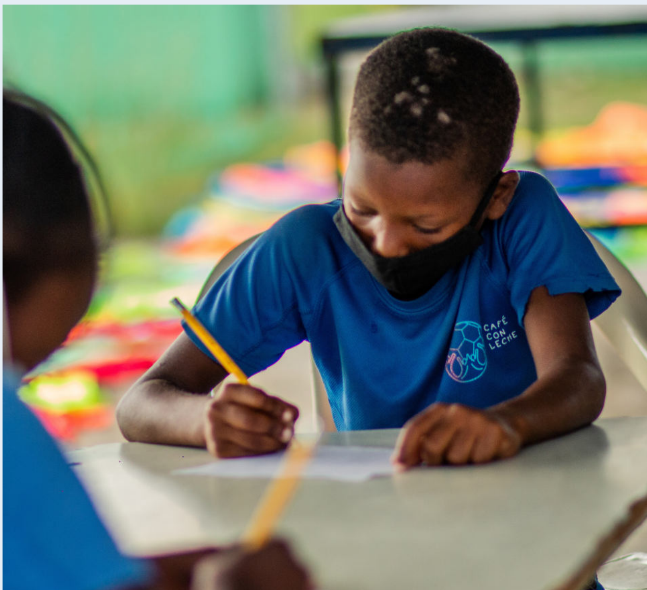
CCL ha adaptado las actividades educativas a las nuevas necesidades durante el 2020.

A través de visitas frecuentes a las escuelas y hogares, CCL asegura la continuidad de la educación de los niños y las niñas