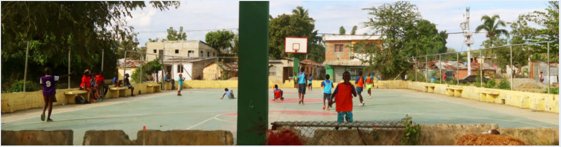
Cancha de Lechería, situada cerca de la casa de los Bambinis.

Aparte de práctica diaria en las instalaciones de CCL, ejecutamos otras actividades deportivas en el Batey Lechería para facilitar el acceso al grupo de menor edad.