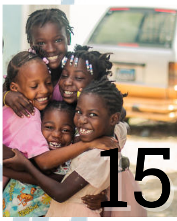
Igualdad de Género