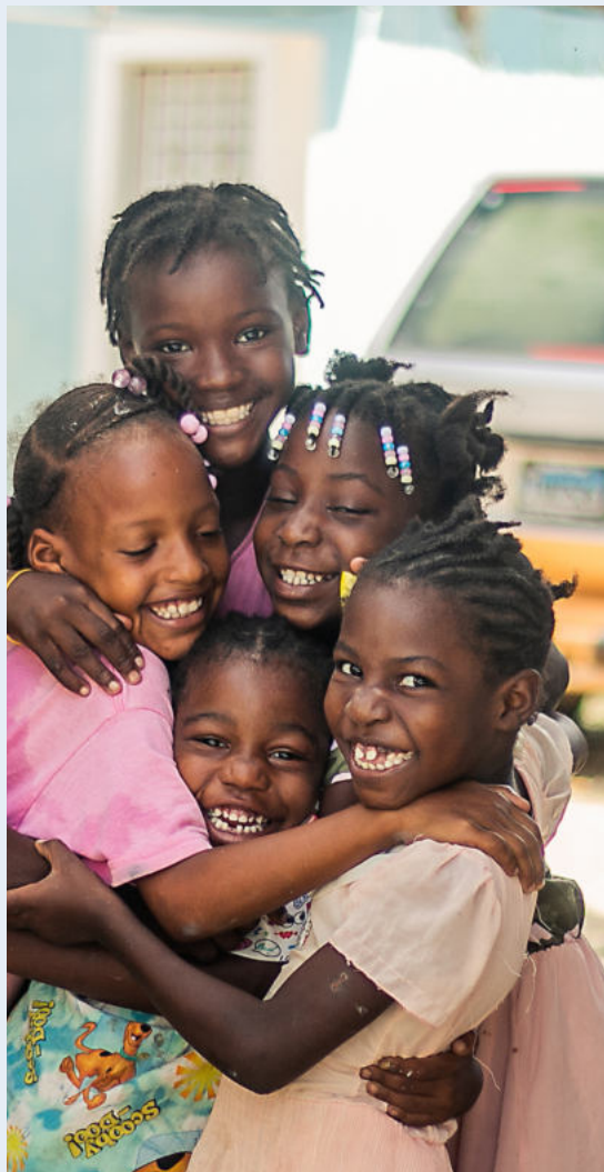
Grupo de niñas en Lechería.

Taller de fotografía impartido por Fotografika