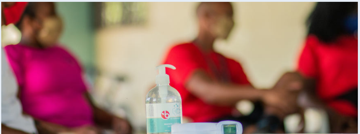
CCL ha implementado medidas de prevención en todas sus actividades.

Este aumento de las dificultades para hacer frente a las necesidades, que a su vez se incrementaron de forma progresiva con la pandemia, implicó incorporar entre nuestras actividades la búsqueda de apoyo alimentario y prevención en salud. En colaboración con la Escuela Santo Niño Jesús Fe y Alegría y a través de la aportación del Ministerio de Educación, entregamos semanalmente alimentos a 20 familias de participantes de CCL.