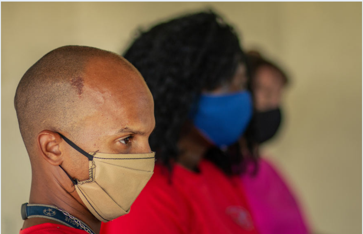
El equipo de empleados de CCL en una reunión para discutir medidas higiénicas.